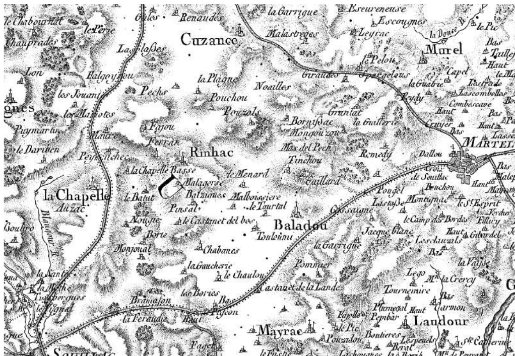
La carte de Cassini pour Baladou et ses environs

Les Maynades, Bornissac = Le Bournissard, Tinchou, Gaillard, Cassagne, La Garrigue, Pommier = Pomié, Le Pigeon, le Chaulou = le Saulou, Chabanes = Chavane, Balzagues=Bazalgie). La seconde catégorie présente sur le territoire communal correspond à de simples maisons isolées. (Mas del Pech, Jacques Blanc, Touloumi = Tourmieu, ainsi que plusieurs maisons non identifiées entre Pomié et Mayrac). Au total, cette carte montre que la toute grande majorité des groupements d'habitats que nous connaissons