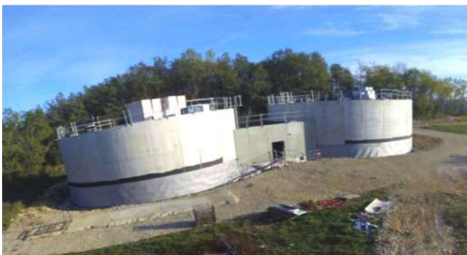
Le nouveau réservoir à la Croix du Rempart (Martel)

Le financement des travaux est assuré comme toujours par une combinaison de sources : subventions (Agence de l'eau ADOUR GARONNE, Département, DETR-Dotation Equipement Territoires ruraux), emprunts, et autofinancement.