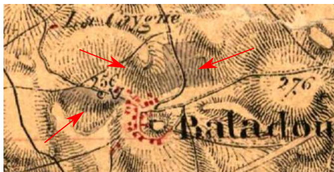
Les vignobles baladins vers 1840 selon la carte d'Etat-Major

qui s'étendait sur tout le coteau en contrebas du Mont Mercou depuis le lieu-dit Boutière jusqu'au-delà du moulin de Cacrej, celui du Baladou représentait néanmoins quelque importance. On note ainsi de la vigne principalement sur le versant exposé au sud-ouest du Pic Aubert; et au nord du Bourg, de part et d'autres de la route de Cuzance et dans le secteur compris entre le Chemin du Presbytère et le chemin des Mousseroux. Le cadastre napoléonien indique d'ailleurs cette zone comme "vigne grande". Au total, les superficies étaient somme toute assez modestes.