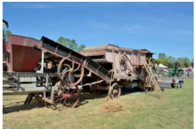
Une batteuse Brouot, fabriquée à Vierzon

A Baladou il y avait un syndicat de battage depuis les années 1919-1920. Je n'ai pas pu trouver la date