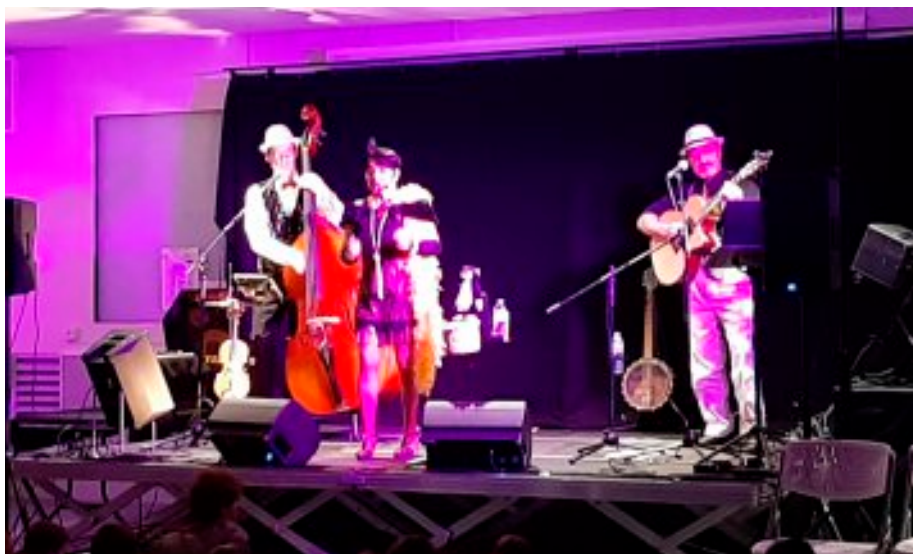
Notre salle des fêtes durant le spectacle donné aux enfants des école de Martel, Cuzance et Baladou