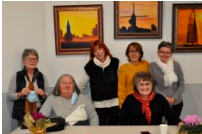
L'équipe des bénévoles de la bibliothèque

Les bénévoles de la bibliothèque ont été particulièrement actives durant ces derniers mois.