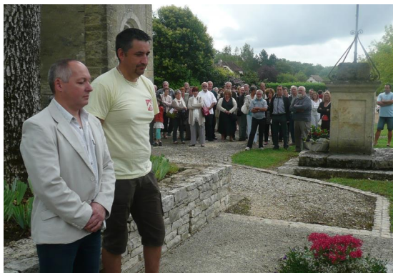
Le dépôt de gerbe au monument aux morts

Telle une tradition, la fête des 14 et 15 août anime la commune en été.