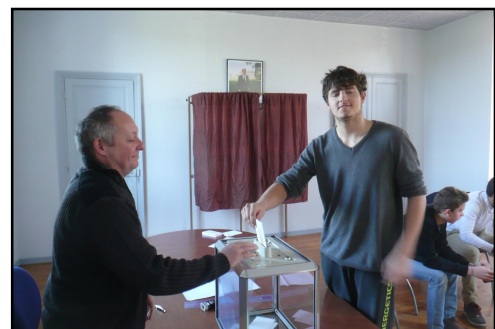
Le plus âgé

Parmi les premiers souhaits émis, ce groupe envisage la création d'un parcours santé, l'organisation d'une course de caisses à savon lors de la fête, l'organisation d'une course empruntant les chemins de randonnée.