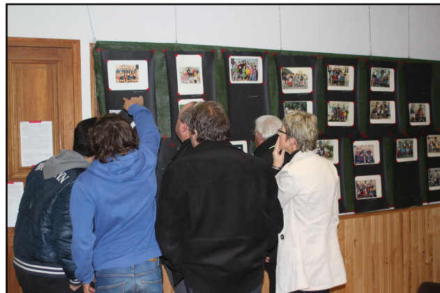
On essaie de se reconnaître

Un entracte a permis aux personnes présentes de manger des gâteaux confectionnés par les parents.