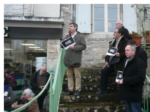
Rassemblement à Martel jeudi 08 janvier 2015 à 11h45