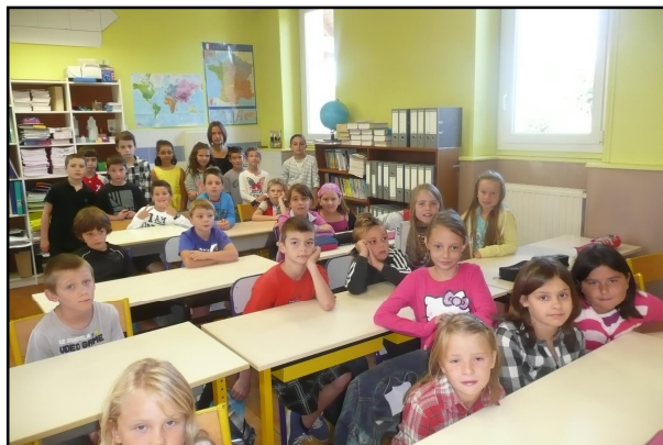
Le jour de la rentrée

Cette année, les effectifs de l'école sont stables 24 élèves : 18 CE2 et 6 CM1