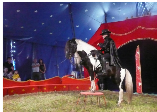
Zorro au cirque