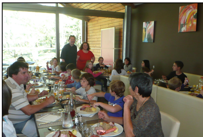
La choucroute à l'Atelier du Goût