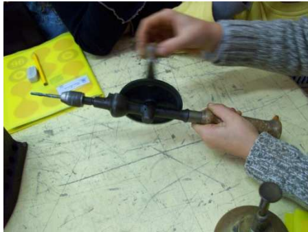
La perceuse à main (chignole)