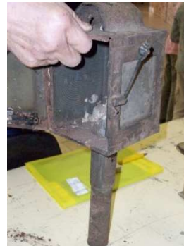
Une lampe de voiture à cheval