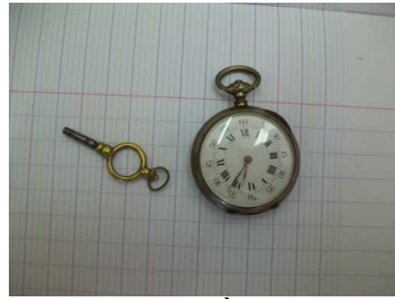
Une montre à gousset