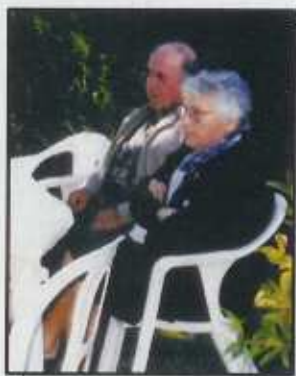
Le Village de Pomié