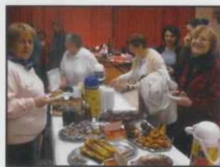
Pâtisseries et boissons chaudes