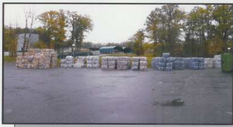
Plastiques et cartons recyclés