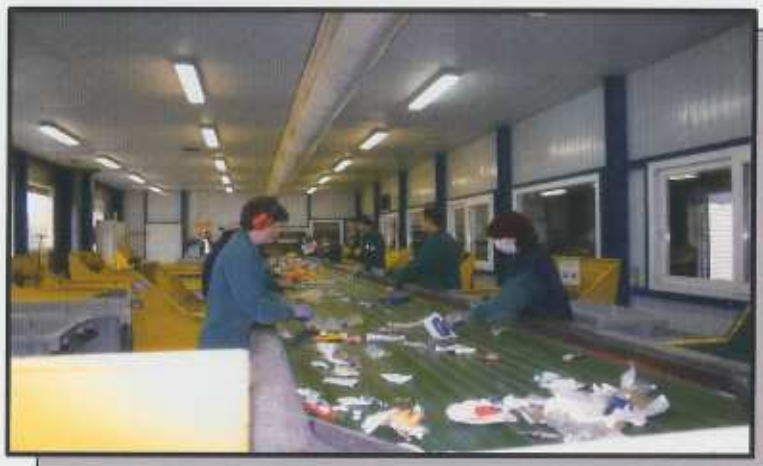
Tapis roulant de triage

Pensons à nos enfants et petits enfants pour laisser une planète propre, qui en a bien besoin.