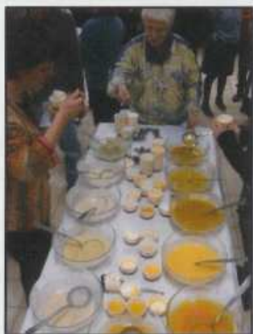
Le concours de soupes