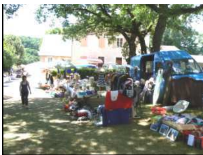
Le vide grenier