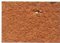
briques moulées ocre rouge foncé