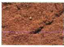
briques moulées rouge