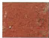
terre ocre rouge