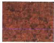
terre rouge safran