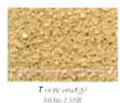
F ocre orange 1030-1100