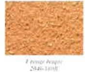
F ocre rouge 2040-1000