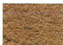
briques moulées ocre