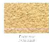
F ocre rose 1520-1400