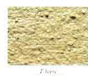
F ocre 2020-1200