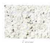
F gris 1010-1200