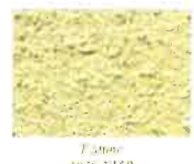
F ocre 1020-1150