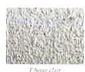
F beige clair 1000-1200