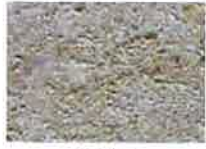
grès ocre Faence