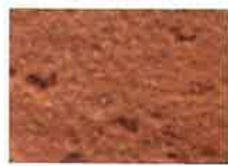
briques moulées ocre rouge