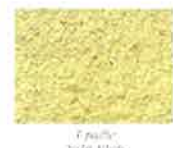
F ocre 2010-1200