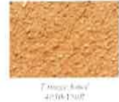
F ocre rouge foncé 4010-1300